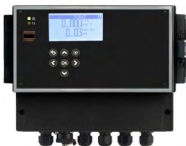
Industrieelektronik und Steuerungen