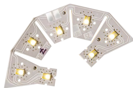
Leuchtmittel für Industrie und Marketing